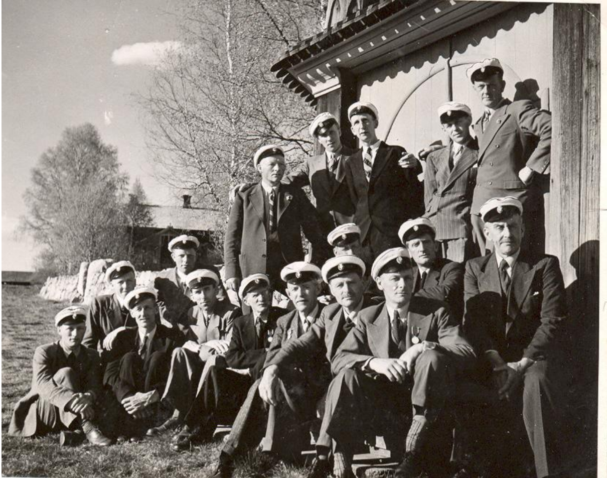
Kortet är taget 1946 (25-års jubileum)