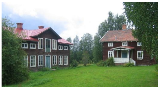
Östervalla i nutid